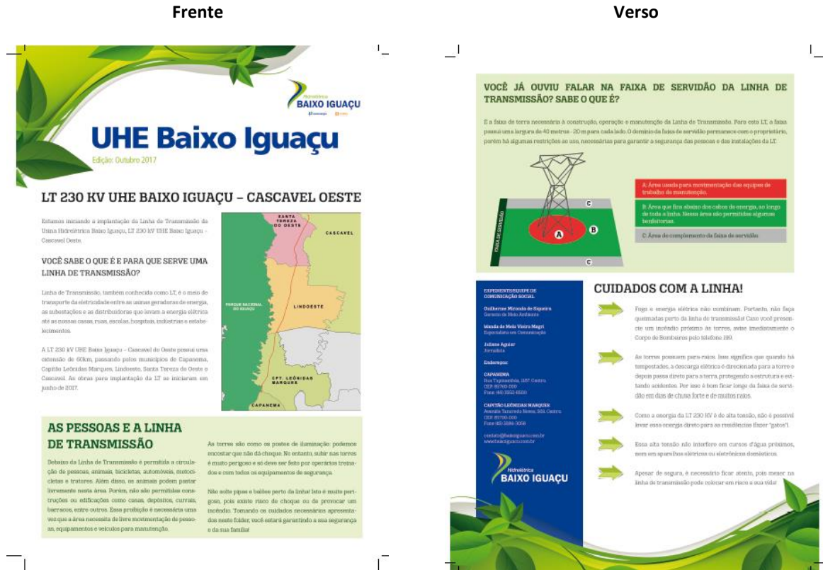
Figura 9-3 - Folder sobre a LT 230 Kv Cascavel Oeste