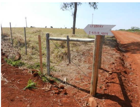
Figura 9-8 - Cartazes fixados no canteiro de obras da LT 230-KV Cascavel Oeste e suas artes.