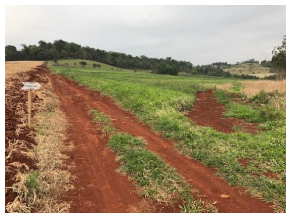
Figura 9-9 – Placas indicativas implantadas sobre a LT 230-KV Cascavel Oeste.