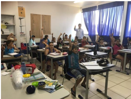
Palestra na Escola Mun. Bartolomeu Bueno da Silva