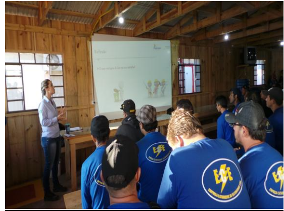
Figura 9-16 - Registro fotográfico do treinamento com os trabalhadores da obra da LT.