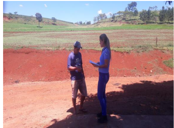
Figura 9-10 - Registro fotográfico das visitas realizadas nas propriedades no período de outubro a dezembro/17.