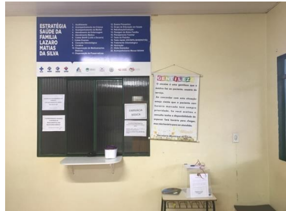
Figura 9-4 - Implantação de urnas nos municípios interferidos pela Linha de Transmissão.