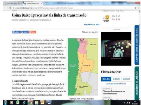
Figura 9-11 - Releases sobre as obras da Linha de Transmissão.

“A energia elétrica a ser gerada pela Usina Baixo Iguaçu será transportada até casas, indústrias, comércio e consumidores em geral pela linha de transmissão 230kV Cascavel Oeste, que vai fazer a ligação entre a Usina em Capanema e a subestação da Copel, em Cascavel. Um trabalho já em andamento e que irá gerar energia para o sistema interligado nacional, além de se tornar um patrimônio para o povo brasileiro. USINA BAIXO IGUAÇU –um rio, uma obra, um futuro.”