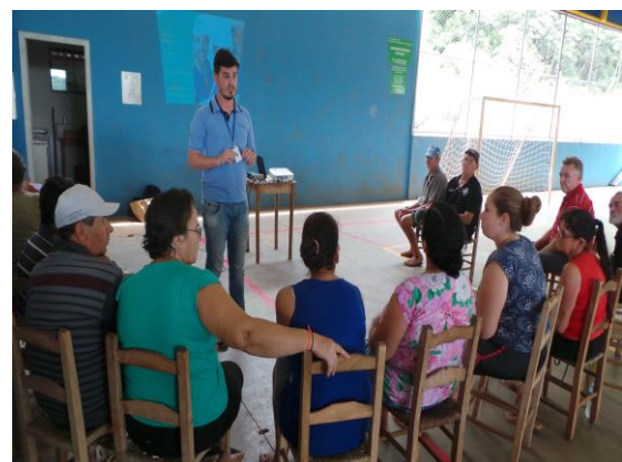
Figura 9-15 - Palestra nas comunidades da LT em Capitão Leônidas Marques.