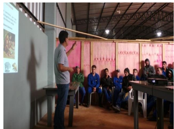
Figura 9-6 - Treinamento com os colaboradores da obra da LT.