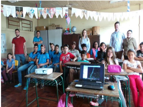
Palestra na Escola Municipal José Linhares