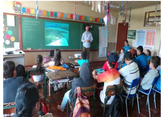
Palestra na Escola Municipal Visconde de Mauá